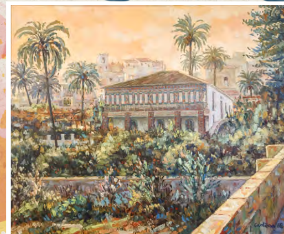
Acuarela de José Antonio Canteras Alonso. (Huerto de García-Alix)